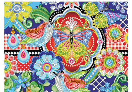
Visual scheme on canvas Наочна схема на полотні Наглядная схема на холсте