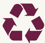
Detailed instructions Докладна інструкція Подробная инструкция