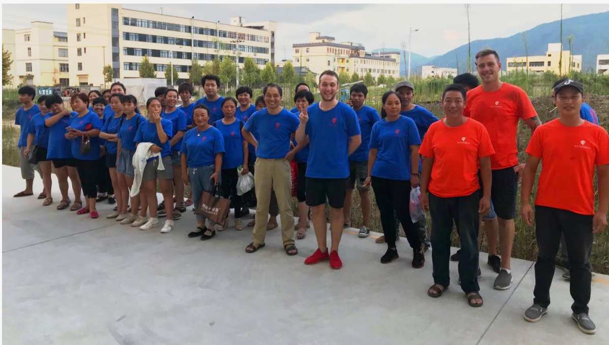
Рабочие и менеджеры фабрики в Китае

В 2012 году мы открыли свою фабрику в Китае, поэтому можем делать наши игрушки по нашим правилам: