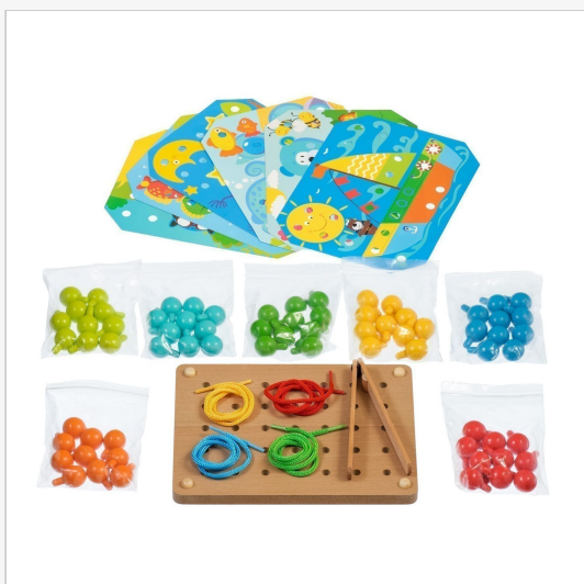
Мозаика логическая Логическая игрушка – «Игрушки из дерева» 4.5 из 5 звезд 313 отзывов