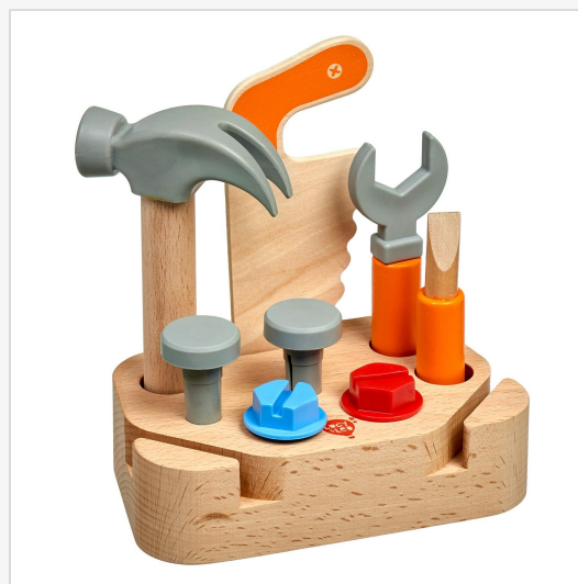
Набор столяра малый Ролевая игрушка – «Lucy & Leo» 4.9 из 5 звезд 41 отзыва