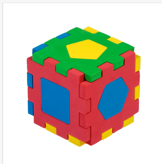
Кубик-геометрия Мягкий пазл – «Бомик» (ЭВА) 4.9 из 5 звезд 53 отзыва