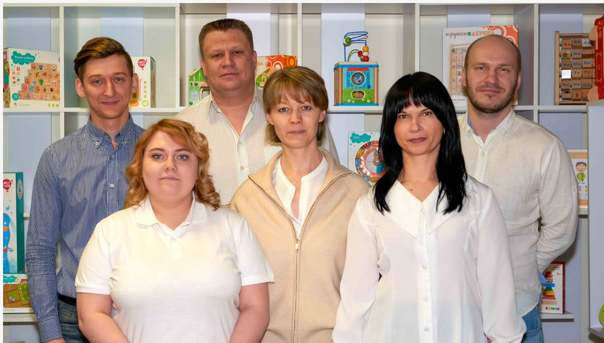
Работники офиса в Москве на фоне шоурума

Назначаем отдельного сотрудника для разных типов клиентов, чтобы успевать обрабатывать все заказы и обращения максимально быстро.