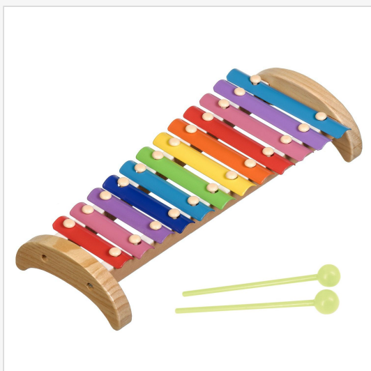
Металлофон 12 тонов Музыкальная игрушка – «Игрушки из дерева» 4.7 из 5 звезд 604 отзыва