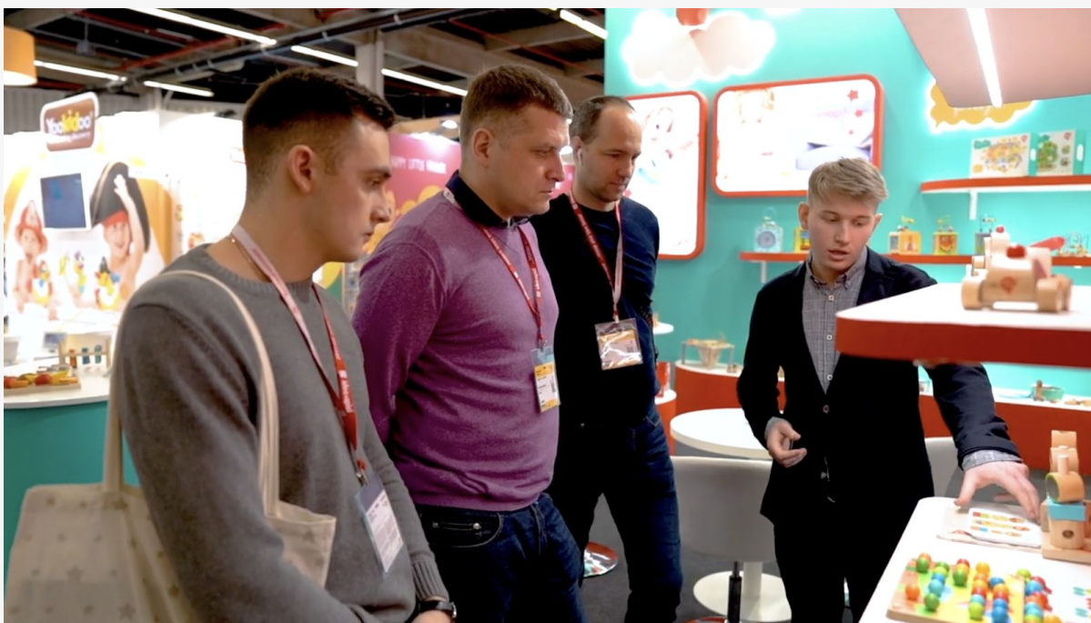
Ярмарка игрушек, Германия, 2020 год.

Участвуем в международных и российских выставках. Мы российская компания и заинтересованы российским рынком также, как и международным. Качество игрушек для России не отличается от качества для других стран.