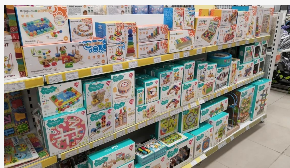
Супермаркет Антошка ТЦ Гулливер, Санкт-Петербург